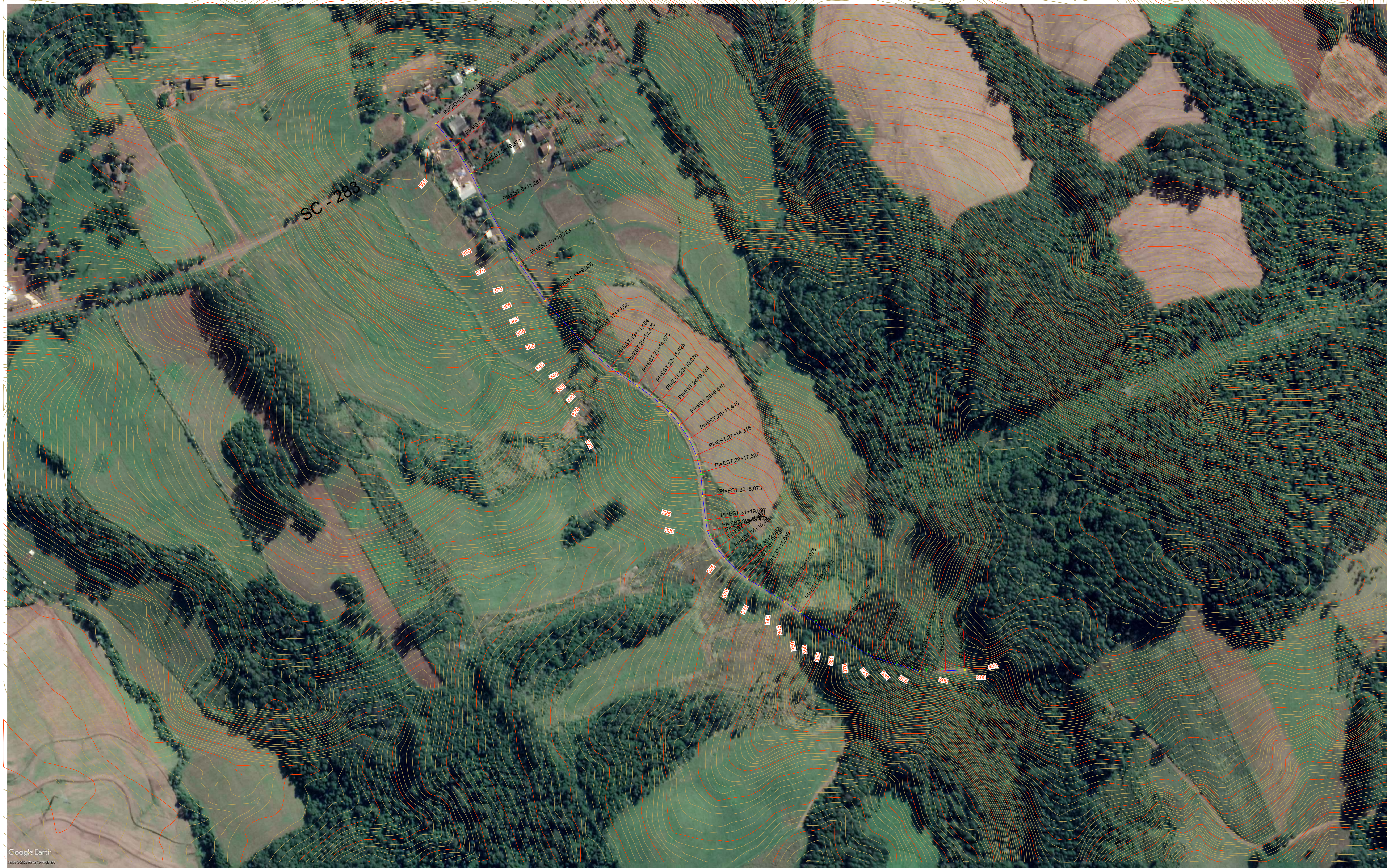
PLANTA DE CURVAS DE NÍVEL ESCALA - 1:2000 ÁREA = 6.300,00 m 2