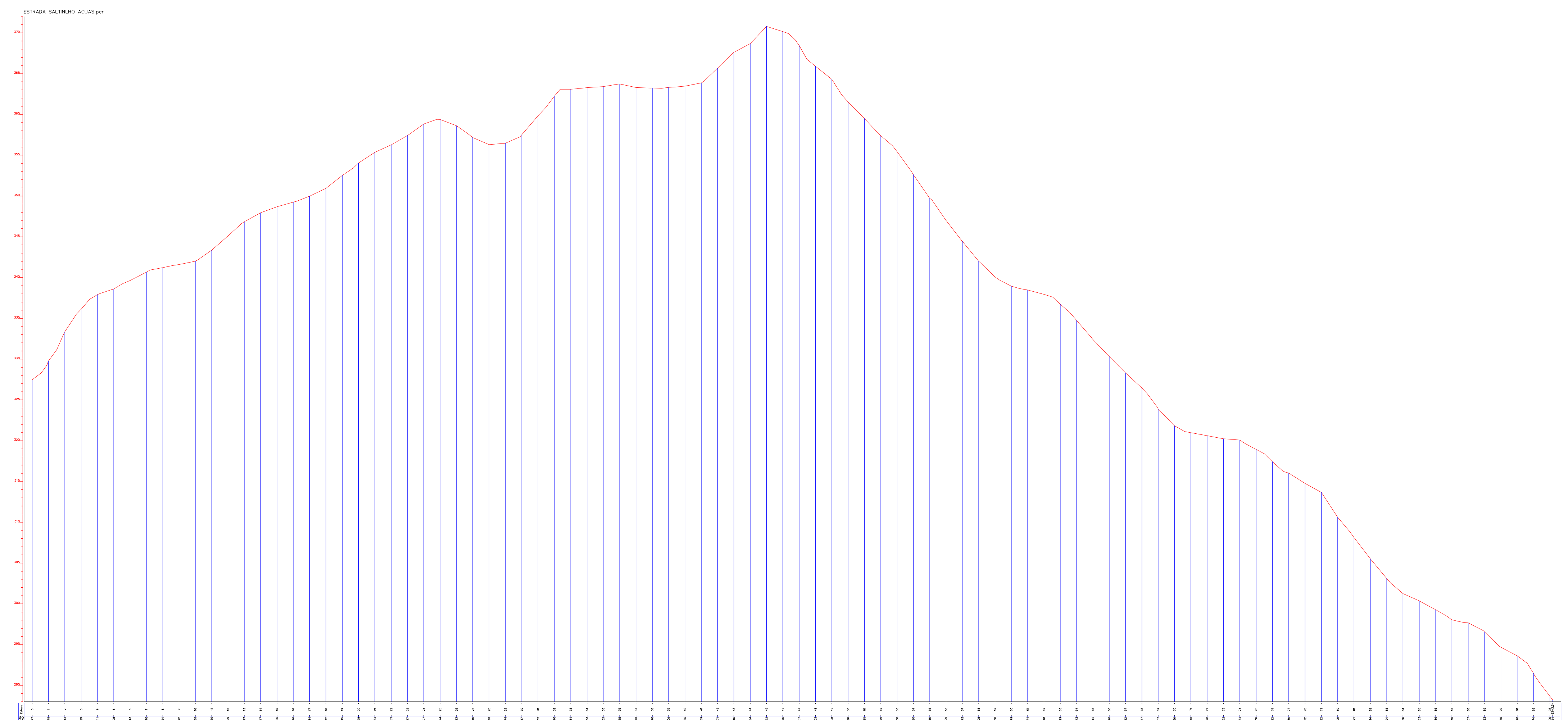
GRIDE VERTICAL ESCALA ESTACAS: 1/1000 ESCALA COTAS: 1/100 ÁREA: 10.808,30 m 2