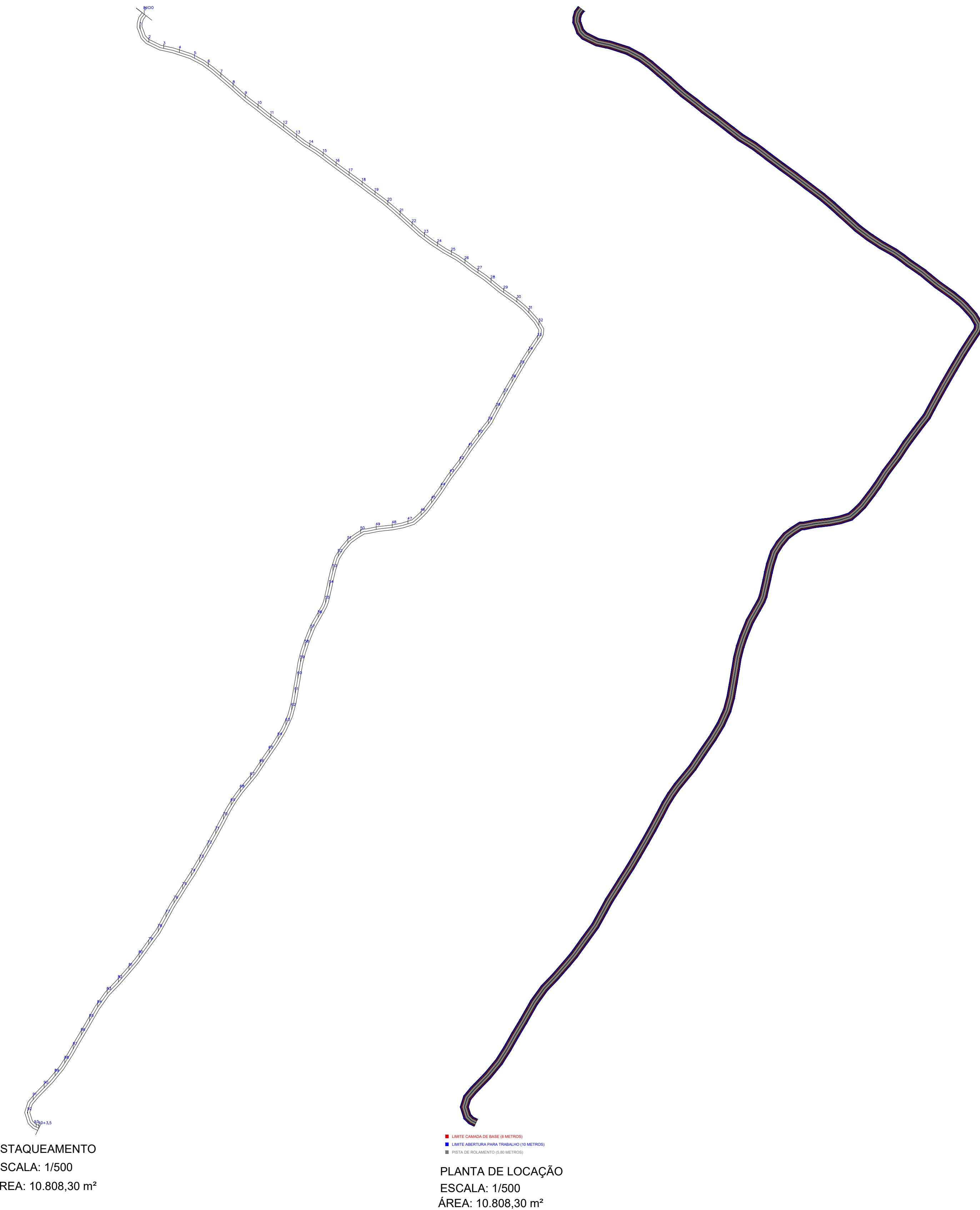
ESTAQUEAMENTO ESCALA: 1/500 ÁREA: 10.808,30 m 2